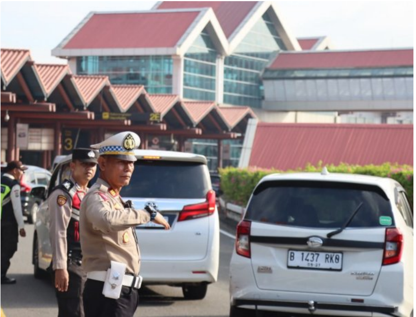
Personil gabungan dari Satlantas Polresta Bandara Soekarno-Hatta sedang Melaksanakan Pengaturan Lalulintas, Kamis, (25/1/2024)